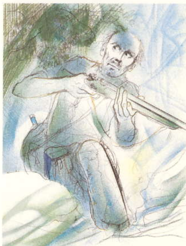
Trois compositions originales de Jean-Baptiste Valadié pour « Jean de Florette ».