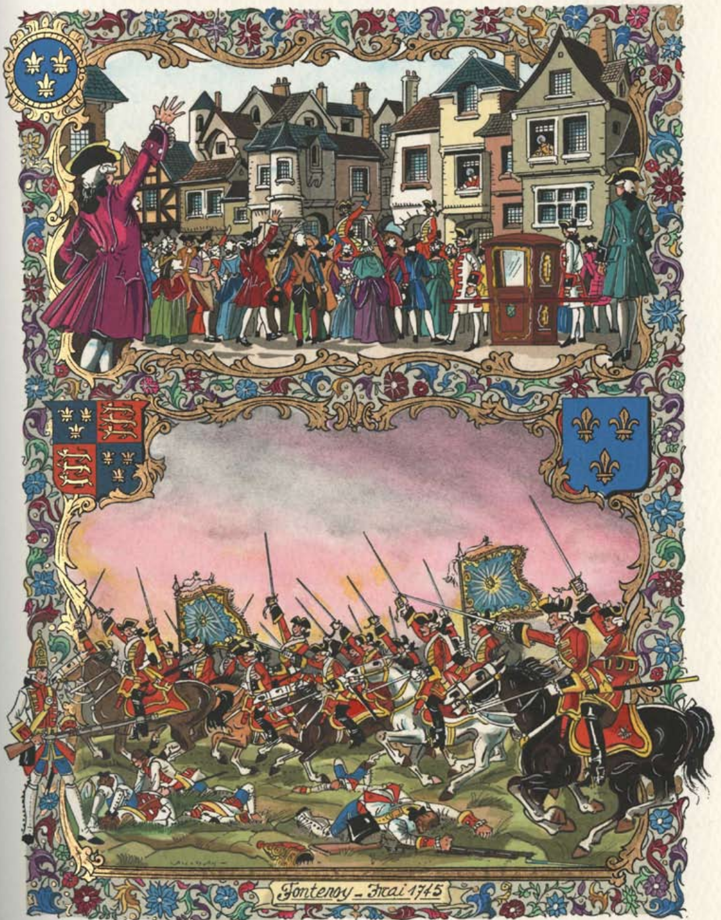
Fontenoy - Mai 1745